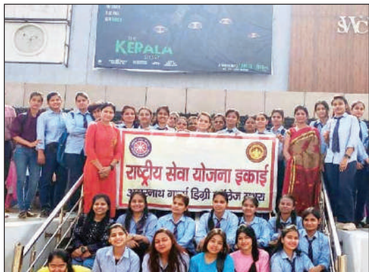
फिल्म में दिखाया गया है वह लड़कियों के साथ गलत करते हैं लड़कियां भावुक होती हैं

टीम एक्शन इंडिया/मथुरा/लोकेश चौधरी। राष्ट्रीय सेवा योजना इकाई की 112 छात्राओं ने सिनेमा हॉल में आयोजित विशेष शो में 'द केरला स्टोरी' फिल्म देखी, फिल्म देख कर छात्राएं भावुक हो गईं। 'द केरला स्टोरी' फिल्म देखकर छात्राएं सिनेमा हॉल से निकलने के बाद भावुक दिखाई दीं और छात्राओं की आंखों में आंसू थे, वहीं छात्राओं का कहना है कि यह फिल्म सच्ची घटना पर आधारित है, जो कुछ भी