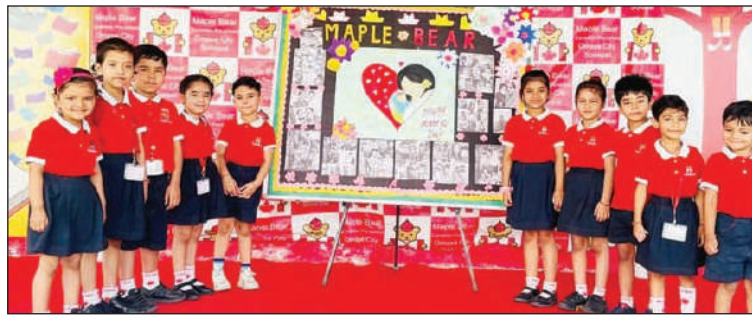
टीएम एक्शन इंडिया/सोनीपत