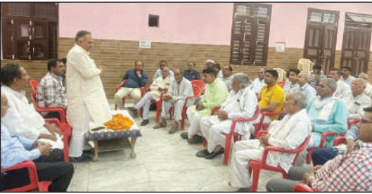
बैठक को सम्बोधित करते हुए व्यक्त किए। उन्होंने कहा कि कांग्रेस के पास देश को आगे बढ़ाने का कोई एजेंडा नहीं होता बल्कि जात-पात, धर्म, क्षेत्रवाद की राजनीति का सहारा लेकर वोट की राजनीति करती